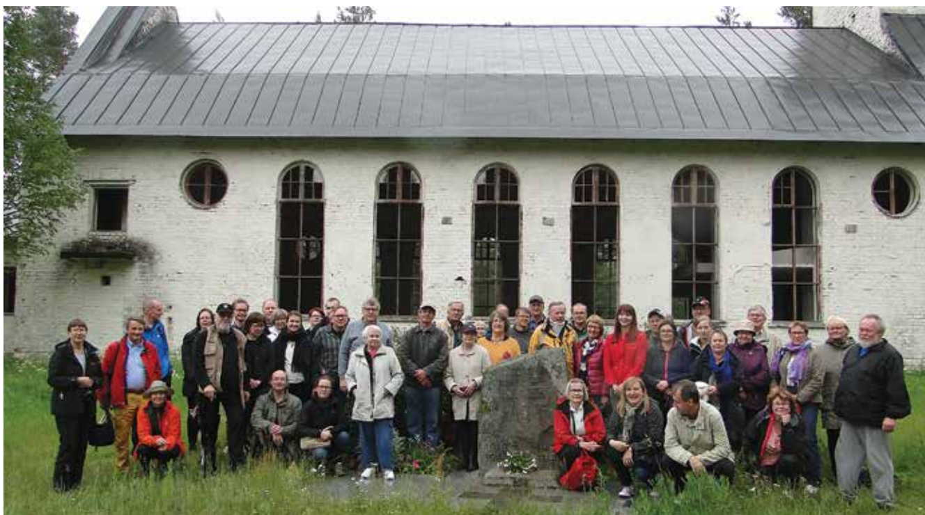
Kun kukat oli laskettu Noimmäen kirkon raunioille, Leiposten hautausmaalle ja sankarimuistomerkillä, keräyntyttiin ryhmäkuvaan ennen paluumatkaa Vuoksenrannan Kankaalan kirkolle.