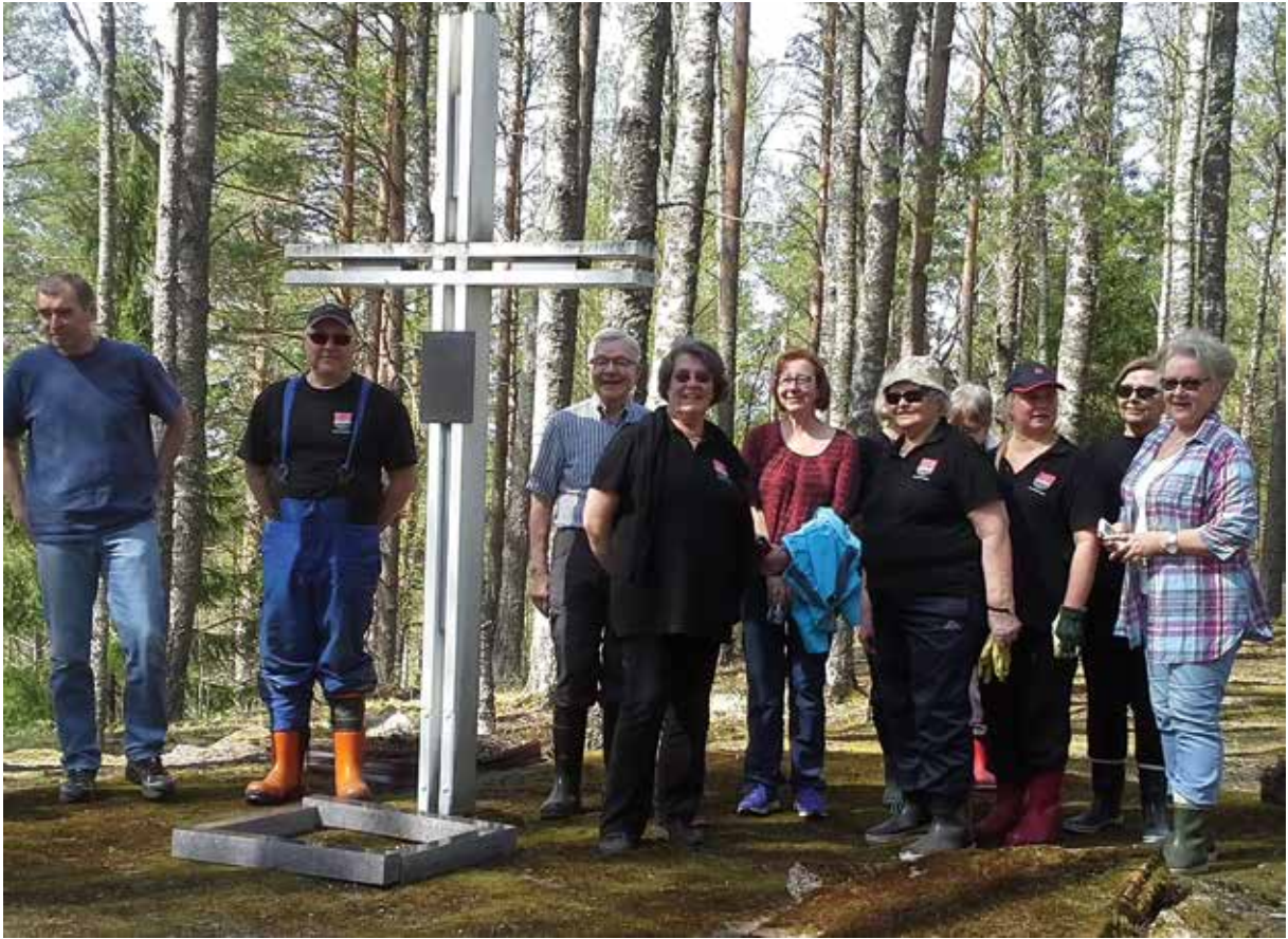
Yläkuvassa talkoolaisia Noinmäen kirkonmäellä.