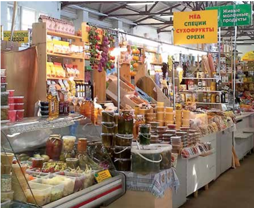
Viipurin kauppahallin tarjonnan runsaus teki vaikutuksen ensikertalaiseen. Venäläiset ovat taitavia säilömään muun muassa hapattamalla.

tuttivat meitä menneistä elämän riemuista ja suruista. Noinmäen kirkon juurella oli jäänteitä entisestä koulusta, mihin luulen mahtuneen suuremman joukon oppilaita.