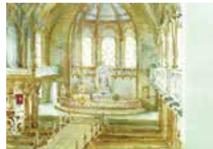
Kortit, aiheet Antrean kirkon sisältä. 1 kpl 1 eur, 5kpl 3 eur