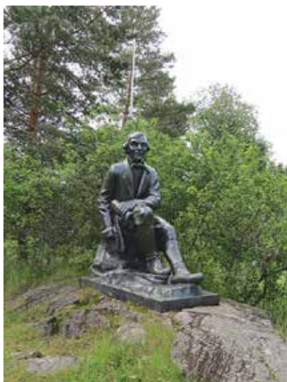
Henttosen kokoontuivat Elias Lönnrotin maisemiin Sammattiin.

Henttosen sukuseura on rekisteröimätön ja sellaisena se pysyy ainakin toistaiseksi jatkossakin, kunnes verotuskäytäntö selviää. Yhdistysla-