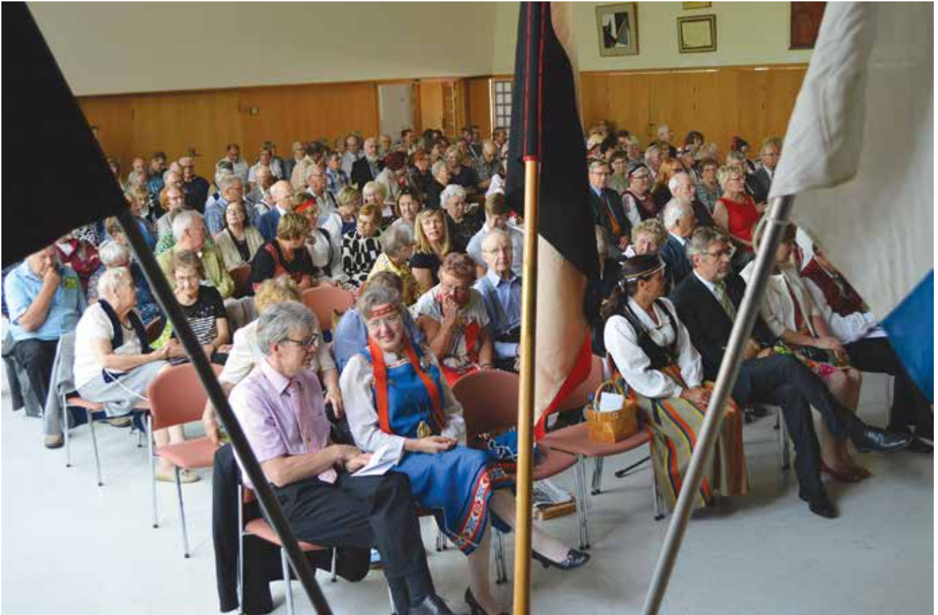
Tervakosken Seuratalon suuri sali täyttyi juhlakansasta. Moni oli mielissään siitä, että nyt ei pidetty väliaikaa, vaan haastelu tapahtui juhlan alussa ruokalautasen äärellä ja juhlan jälkeen lähtökohveja juodessa.