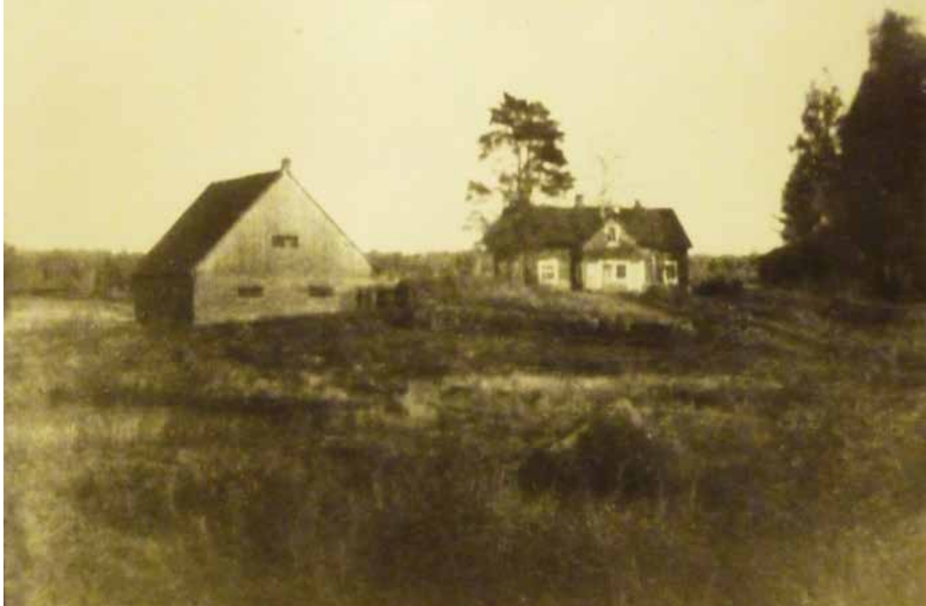
Vanhavalkama vuonna 1930.